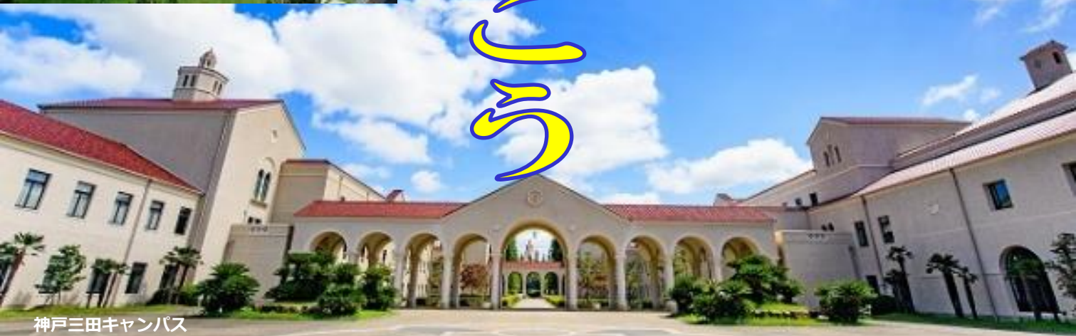
神戸三田キャンパス