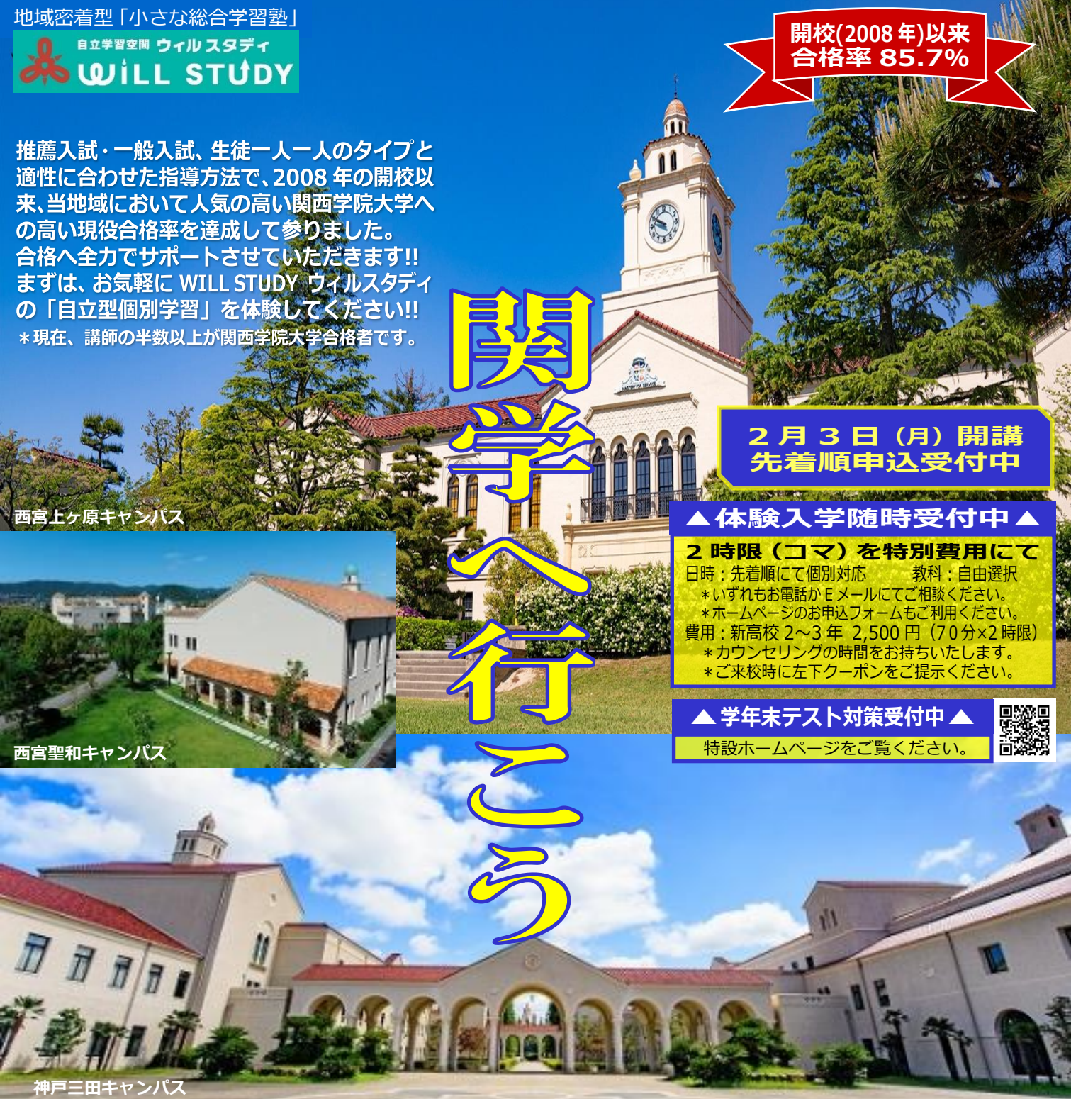
西宮上ヶ原キャンパス