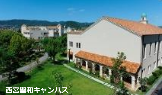
西宮聖和キャンパス